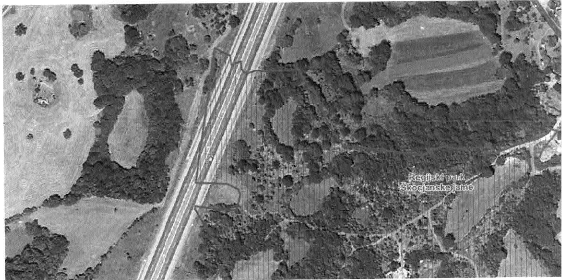
Slika 1: AC in Meja zaščitene območja parka Škocjanske jame

Republika Slovenija pri posegih v prostor ne gleda niti na meje zaščitene območij, niti na zavarovana območja. Avtocesta med Divačo in Kopro, po kateri promet narašča iz dneva v dan, je široka cca. 30 m brez vplivnega območja. Mejo zaščitene območja Regijskega parka Škocjanske jame gladko povozi (glej sliko 1), pa vendar se o tem posegu ne govori niti ne piše.